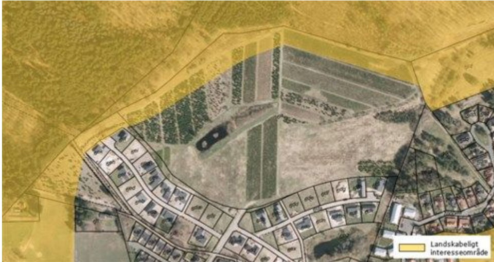
Figur 3: Dele af rammeområde 41-B-19 er udpeget som landskabeligt interesseområde i Kommuneplan 2017-2028. I lokalplanlægningen tages der hensyn til det landskabelige interesseområde ved at udlægge det som fælles fri- og opholdsareal og ikke tillade bebyggelse i området.