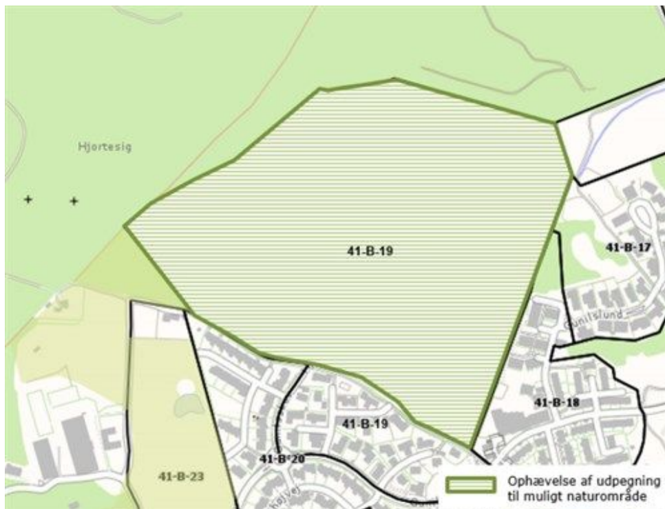
Figur 2: Den markerede del af kommuneplanramme 41-B-19 er udpeget til muligt naturområde i Kommuneplan 2017-2028. Denne udpegning ophæves med Kommuneplantillæg nr. 20.