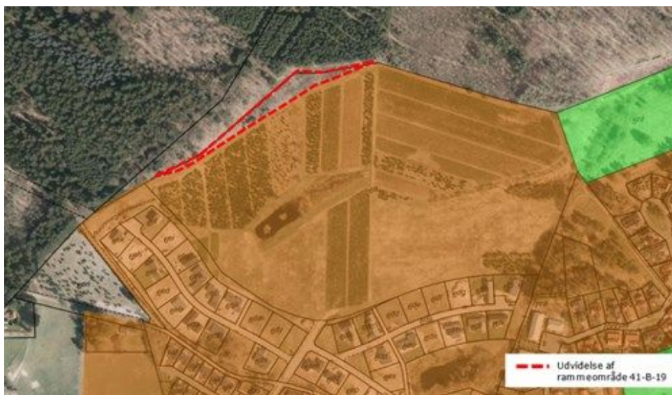
Figur 1: Rammeområde 41-B-19 udvides med kommuneplantillægget med det afgrænsede areal på ca. 0,4 ha.

I forbindelse med lokalplanudarbejdelsen for området har det været nødvendigt at tilpasse afgrænsningen af kommuneplanramme 41-B-19, som det fremgår af kortet nedenfor. Årsagen hertil er, at rammeområdets afgrænsning i Kommuneplan 2017-2028 ikke følger matrikelgrænsen for matr.nr. 6a, Virklund by, Them.